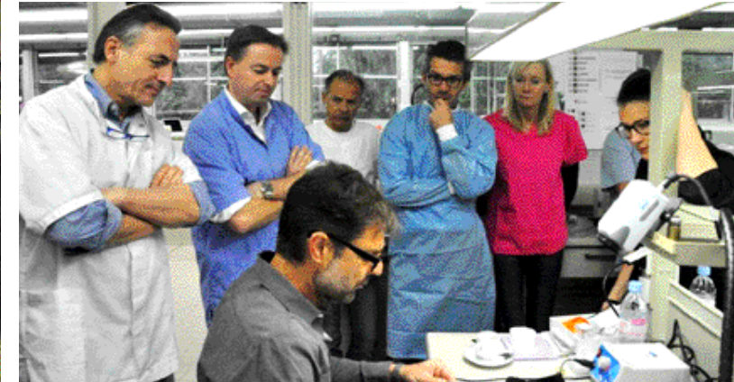
Des élèves contemplatifs mais surtout dubitatifs quant au résultat de leur travaux pratiques.