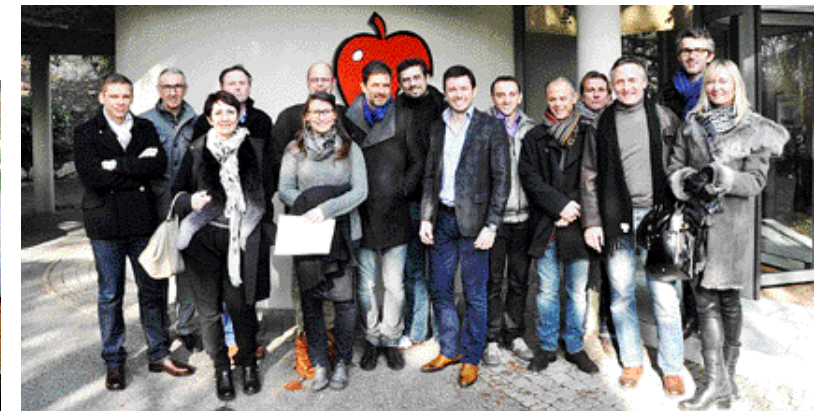
Groupe au complet venu des quatre coins de la France et même du Luxembourg